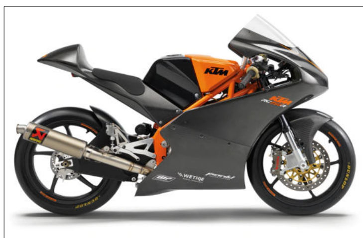
Foto oben: KTM RC 250 R Production Racer wird im Northern European Cup gefahren.