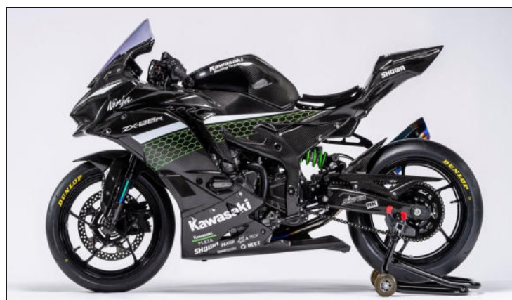
Foto oben: Kawasaki Ninja 400 ist in den Läufen zur SSP 300 Weltmeisterschaft sehr erfolgreich.