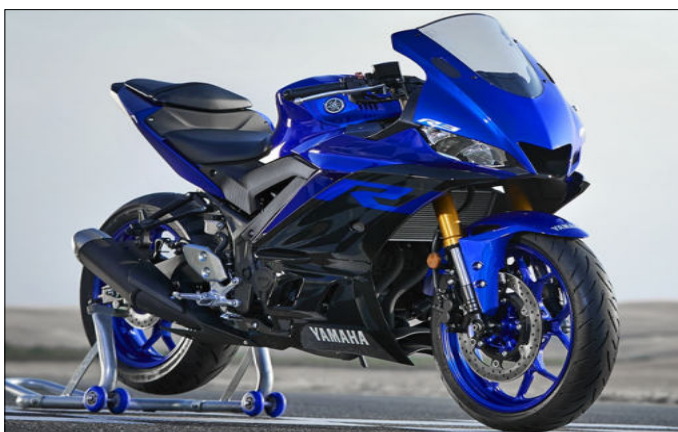
Foto oben: Yamaha R 3 wird als Cup-Motorrad in der Marken-Serie eingesetzt.