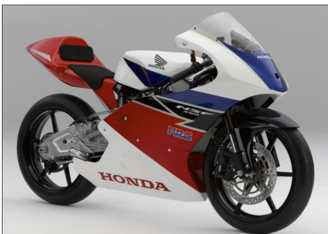
Foto oben: Honda NSF 250 R Production Racer wird in mehreren europäischen Serien der Honda Talent Challenge eingesetzt.